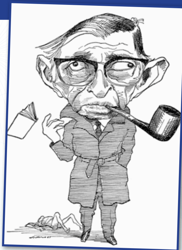
Jean-Paul SARTRE (1905 – 1980) È considerato uno dei più importanti rappresentanti dell'esistenzialismo.